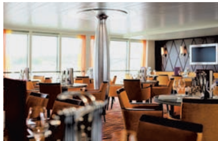
Eines der Bord-Restaurants, in denen die Gäste kulinarisch verwöhnt werden.