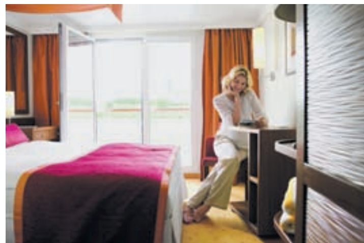
Blick in eine Aussenkabine mit französischem Bett.

Daneben wird viel für Entspannung und Aktivität geboten. SPA-ROSA heisst der Wellnessbereich an Bord. Er umfasst Sanarium, Aussenwhirlpool,