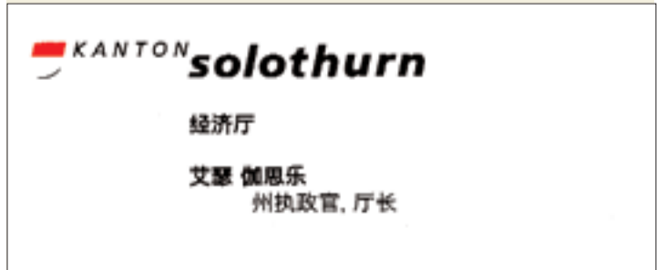
WAS STEHT DA DRAUF? Visitenkarten seien in China äusserst wichtig berichteten die Solothurner Chinafahrer. Hier ist die Karte eines Regierungsmitglieds abgebildet: Wer kann lesen, wem sie gehört?